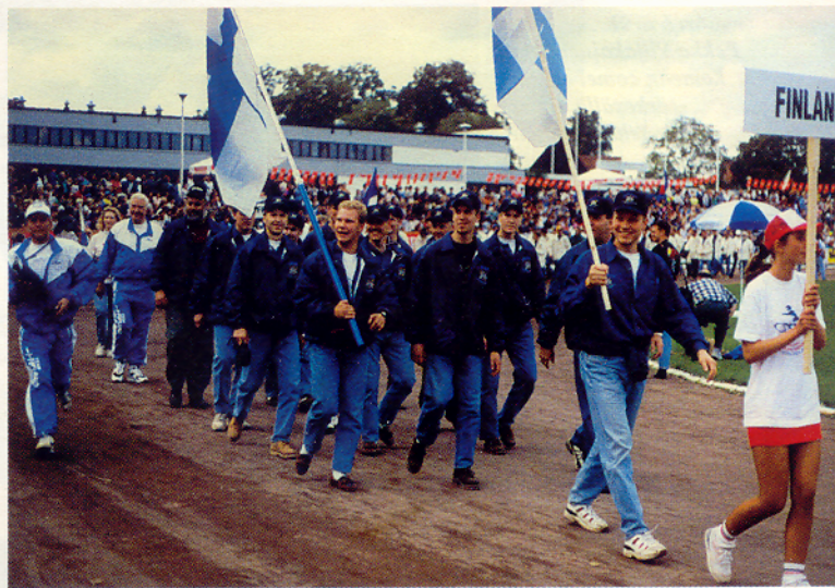
Suomi-poika ryhdikkäänä avajaisissa.

Viljakaisesta olikin jo juttua, vanha herra ei mielellään kaadu. Mutta ajoi kiinni edellä lähteneen ja siinähän