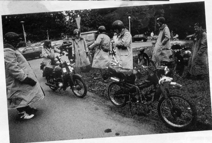
Erikoisin katselijaporukka tuli Man-saarelta kaksikerros bussilla. Päivittäin porukka liikkui viritetyillä Honda 50 Cubeilla.

lään tietoa pelistä illaksi, pääsis vähän irrottelee.