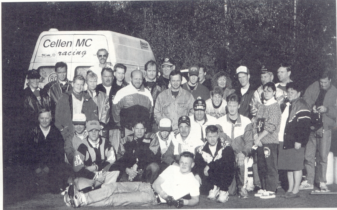
Suomen joukkue perhepotretissa.