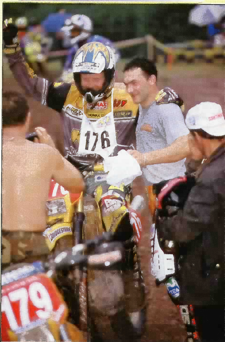
Super Kari ja Super Mario. Nelarikunkut kisan tauottua.