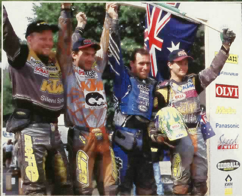
Maailmanmestarit mallit 1997 Kari Tiainen Suomi, KTM Mario Rinaldi Italia, KTM, Stephan Peterhansel Ranska, Yamaha ja Shane Watts Australia, KTM.