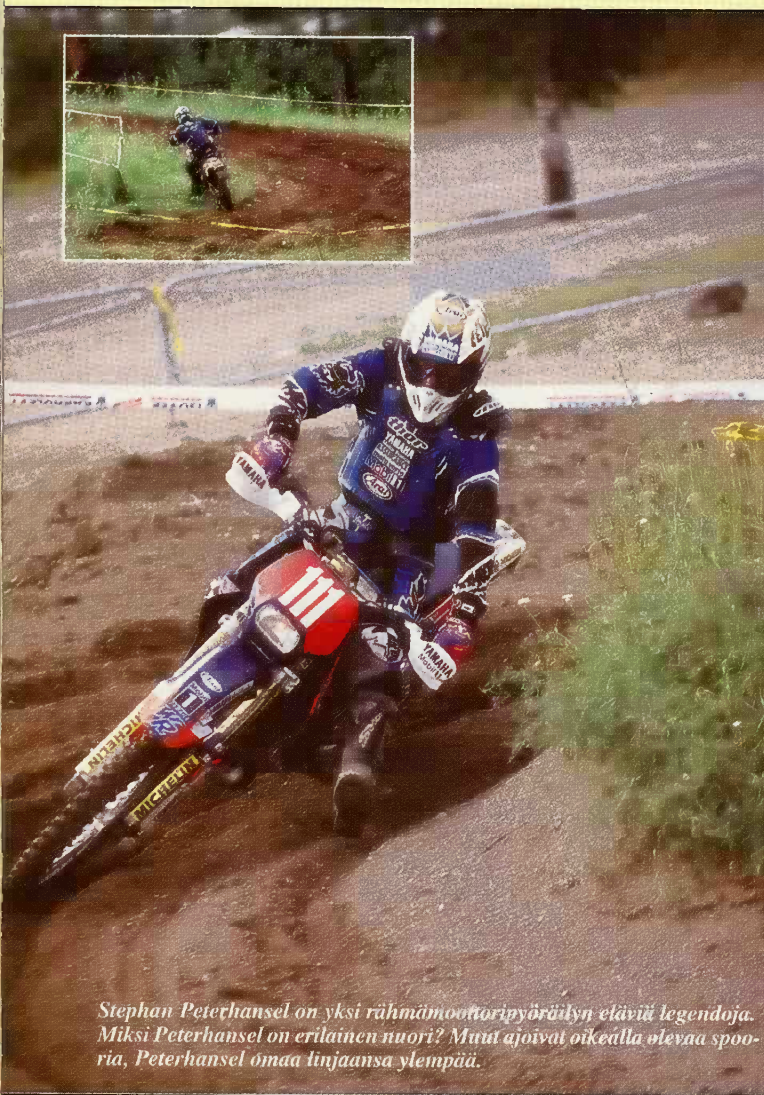
Stephan Peterhansel on yksi rähmämoottoripyöräilyn eläviä legendoja. Miksi Peterhansel on erilainen nuori? Muut ajoivat oikealla olevaa spooria, Peterhansel omaa linjaansa ylempää.