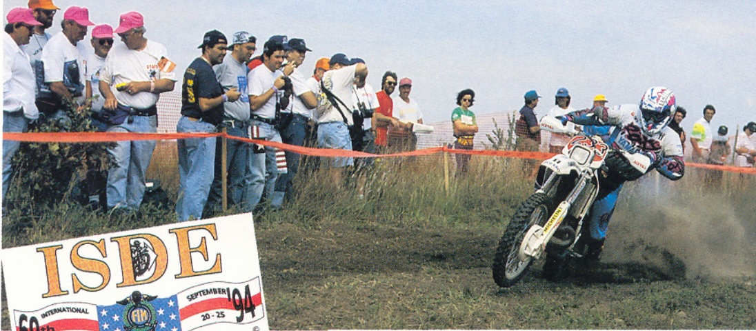
Nopea se on. Stefan Peterhansel antaa kyytiä kymppitonin Jammulle.