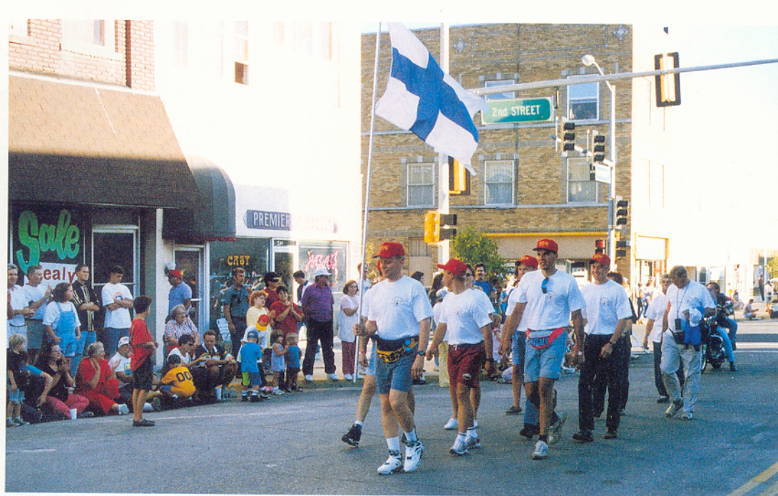
Pieni mutta ryhdikäs Suomen joukkue avajaismarssissa.