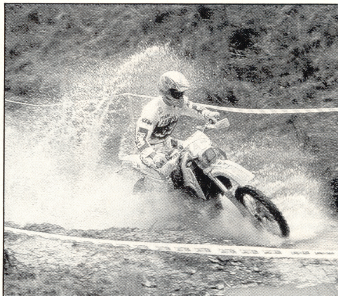
Tintin ainoa todellinen uhka MM:ää ajatellen on tšekki Katrinak.

Harmi vain, että at-pinnat sekoittivat järjestäjien tulospalvelun niin totaalisesti, että lopputu-