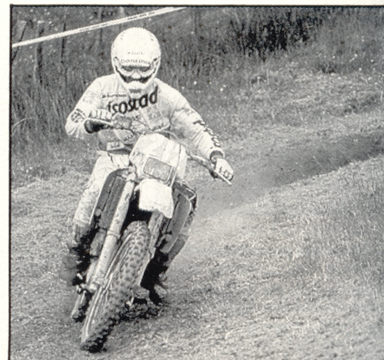
Farioli on paha häiskä onnistuessaan.

Ruotsi, niin voi hyvinkin toivoa, että Tintti nappaa kolmannen MM-tittelinsä.