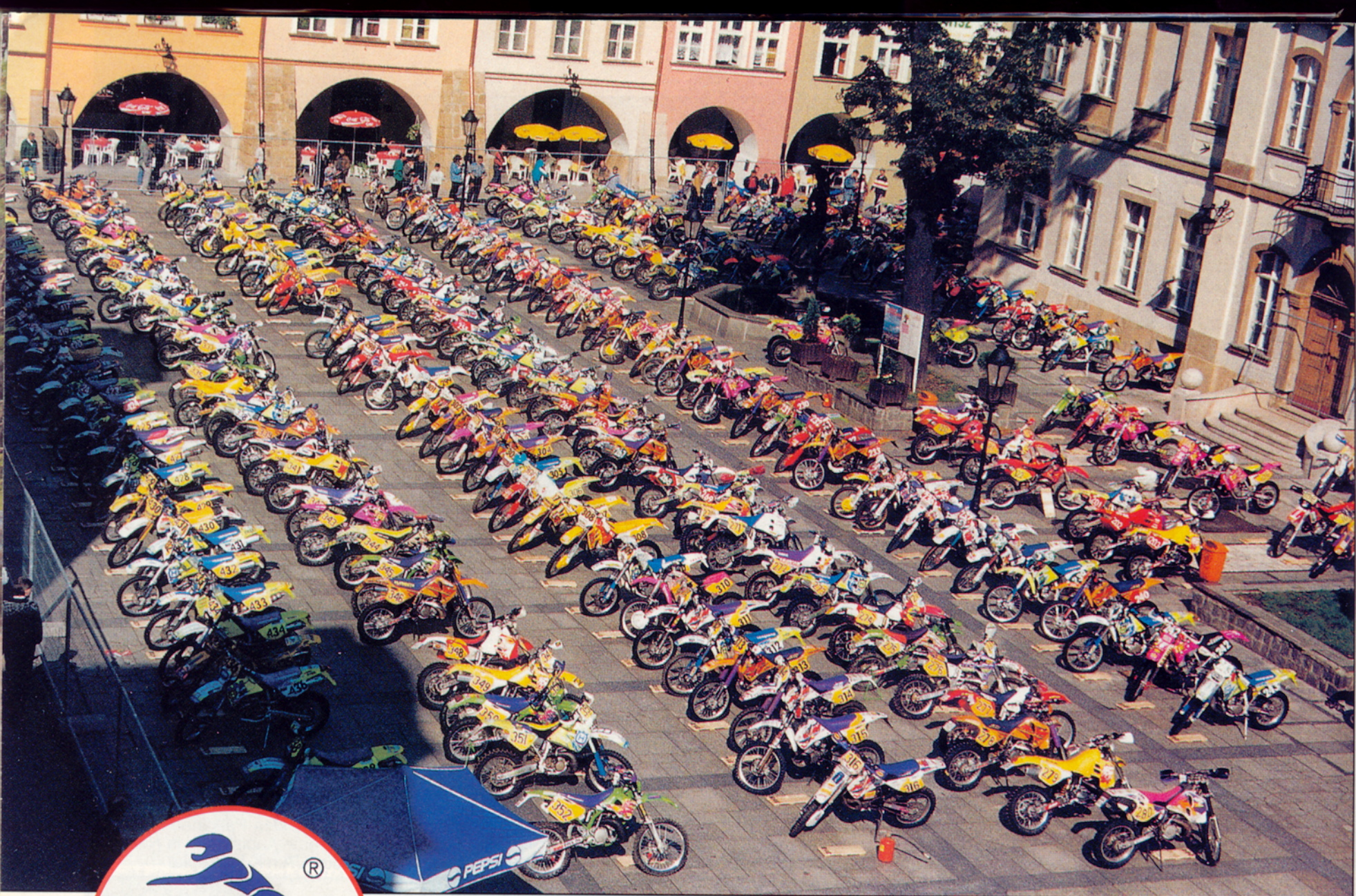
Pyörät suljetulla varikolla ennen H-hetkeä. Aikamoinen näky.